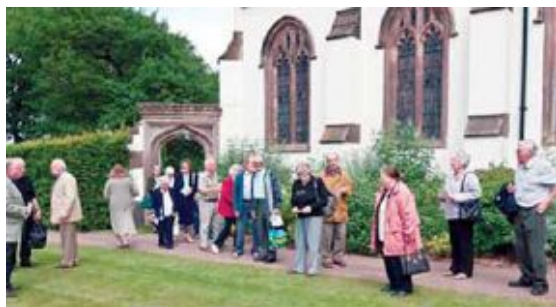
Si va nella cappella per firmare il registro dei visitatori

Ora so che non fu una cosa ecologicamente buona da fare, e probabilmente anche dannosa se la bottiglia si fosse rotta e qualcuno si fosse tagliato i piedi su un vetro rotto. Ma in quegli anni lontani, nella nostra immaginazione quella bottiglia sarebbe potuta essere spinta dal vento intorno al mondo in qualche posto esotico.