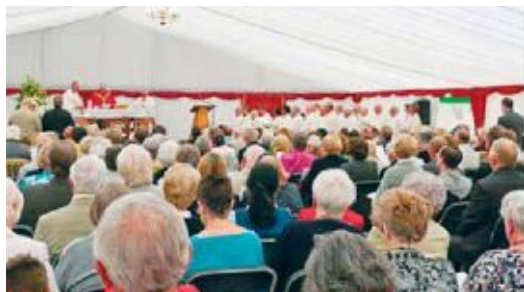
Celebrazione della santa messa