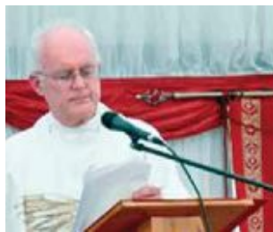
il nuovo padre provinciale

Ora so che non fu una cosa ecologicamente buona da fare, e probabilmente anche dannosa se la bottiglia si fosse rotta e qualcuno si fosse tagliato i piedi su un vetro rotto. Ma in quegli anni lontani, nella nostra immaginazione quella bottiglia sarebbe potuta essere spinta dal vento intorno al mondo in qualche posto esotico.