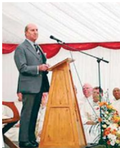
Mister De Lisle pronuncia il discorso commemorativo

La nuova provincia è costituita da confratelli viventi in Nuova Zelanda, Stati Uniti, Irlanda e Regno Unito. Tra di noi ci sarà una forte unione