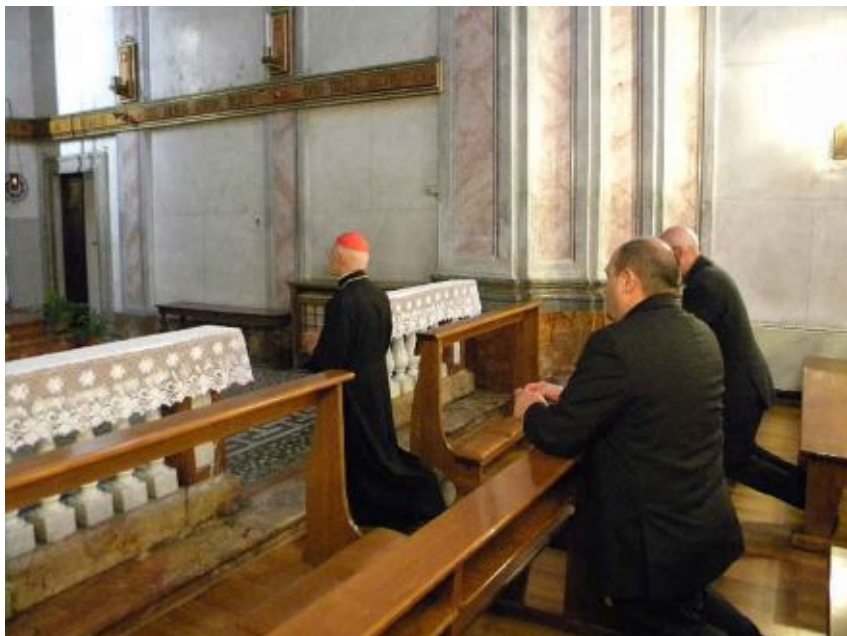
Sacro Monte Calvario, 30 giugno 2010: il cardinal Bagnasco nell'Oratorio dei Religiosi durante la sua visita

Sotto: un momento della solenne celebrazione del 1 luglio a Stresa