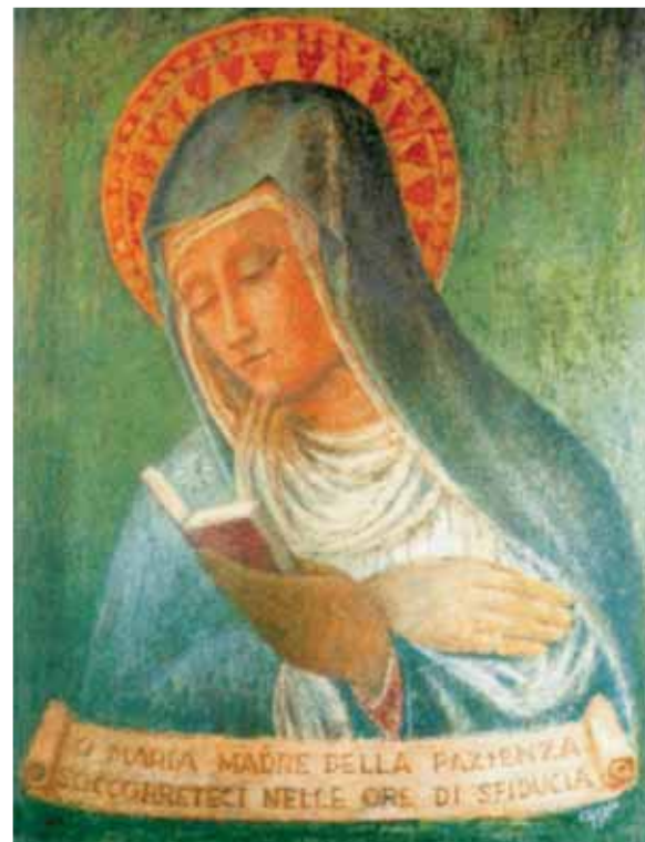
Madonna della Pazienza, venerata nella Parrocchia San Romano a Milano.

Raccomando di trattare con dolcezza e carità senza fine, sopportare i difetti con vera longanimità e pazienza.