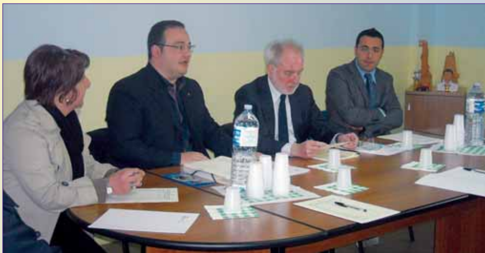
L'onorevole Carra durante la conferenza stampa.

liani per accogliere e per dare una risposta alle grandi contraddizioni della globalizzazione dei conflitti in corso, in un'epoca così travagliata come la nostra, a dimostrazione del fatto che gli italiani non stanno con le mani in mano. Ho trovato gente che lavora anche 24 ore al giorno, dimostrando come si fa a rispondere a questo dramma mondiale, proprio in un momento in cui in Europa non vogliono fare la stessa cosa».