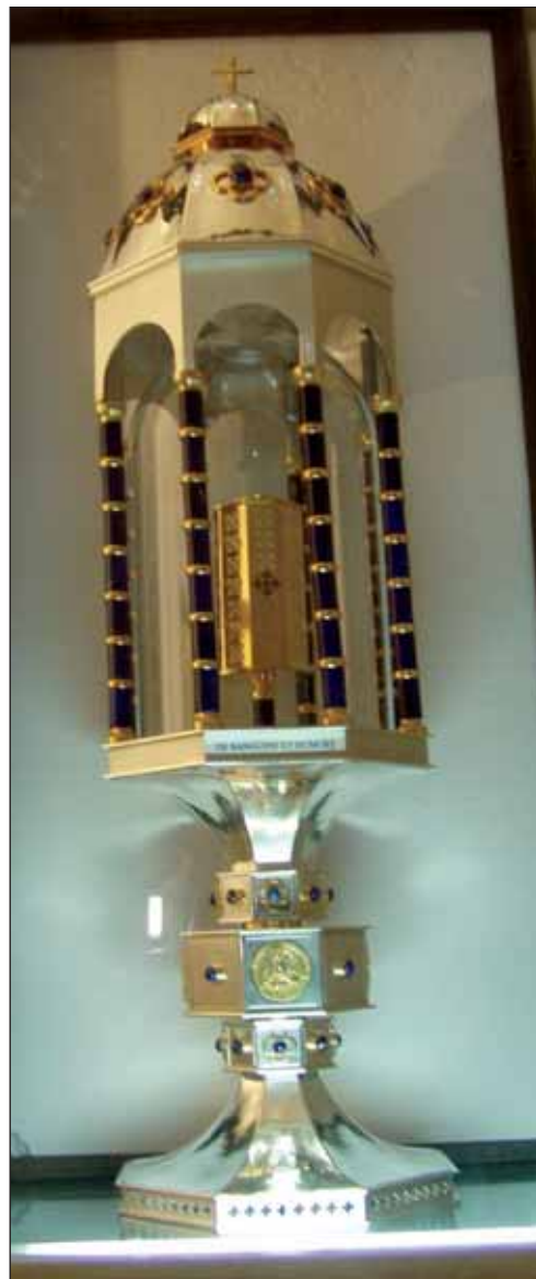
Reliquia del Beato Rosmini.