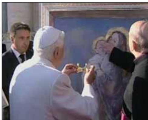
Benedetto XVI incorona l'ìcona di Maria e del Bambino a San Pietro nel novembre 2008.

bene come funziona questo importante Santuario: la radio presta molta attenzione a tutti i bisognosi, orfani, carcerati, anziani, persone sole e stranieri. Questo Santuario è stato anche molto voluto dal Beato Giovanni Paolo II, il quale gli ha dedicato anche una preghiera.