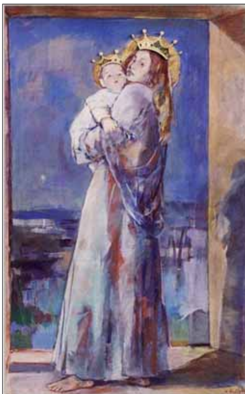
Maria Stella dell'Evangelizzazione, Patrona di Tele Pace.

la Vergine Maria con Bambino molto commovente e suggestiva a vedersi.