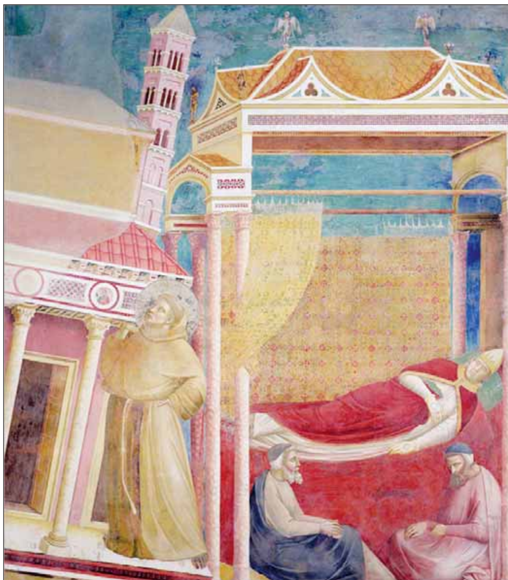
Il sogno di Innocenzo III, Basilica Superiore della Chiesa di San Francesco ad Assisi.

che porge le spalle a sorreggere la Chiesa Pericolante. Molti secoli sono passati, ma forse in quel momento la crisi era anche peggiore dell'attuale.