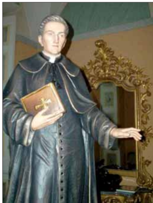
Particolari della nuova statua del Beato Antonio Rosmini.