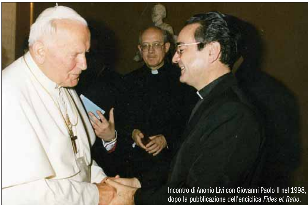
Incontro di Antonio Livi con Giovanni Paolo II nel 1998, dopo la pubblicazione dell'enciclica Fides et Ratio .