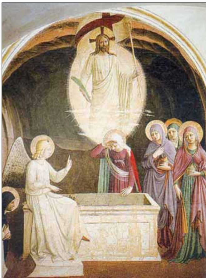
Beato Angelico, Pie donne al sepolcro , Conv. San Marco 1439-1442.

Dalla redazione gli Auguri di una Santa Pasqua di Risurrezione.