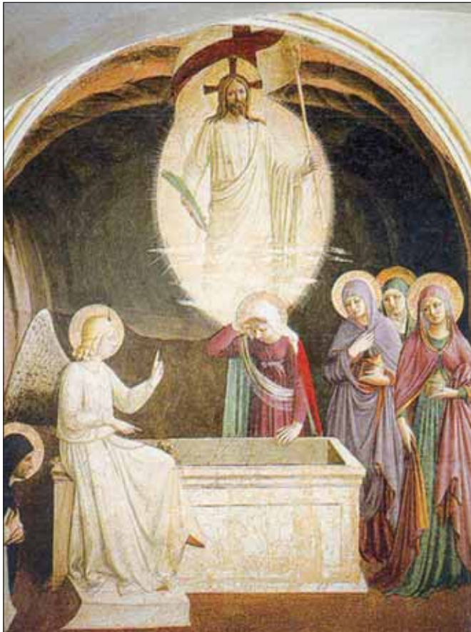
Beato Angelico, Pie donne al sepolcro , Conv. San Marco 1439-1442.

Dalla redazione gli Auguri di una Santa Pasqua di Risurrezione.