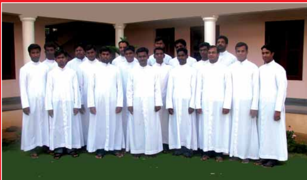
Gli scolastici della Provincia Indiana