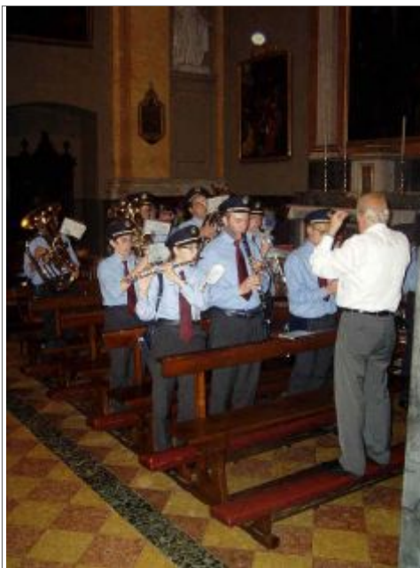
Il corpo musicale Mottarone presente nonostante il mal tempo

È per questo che l'Amministrazione e la popolazione della città di Stresa partecipa al corteo di omaggio civico al suo Beato Antonio Rosmini.