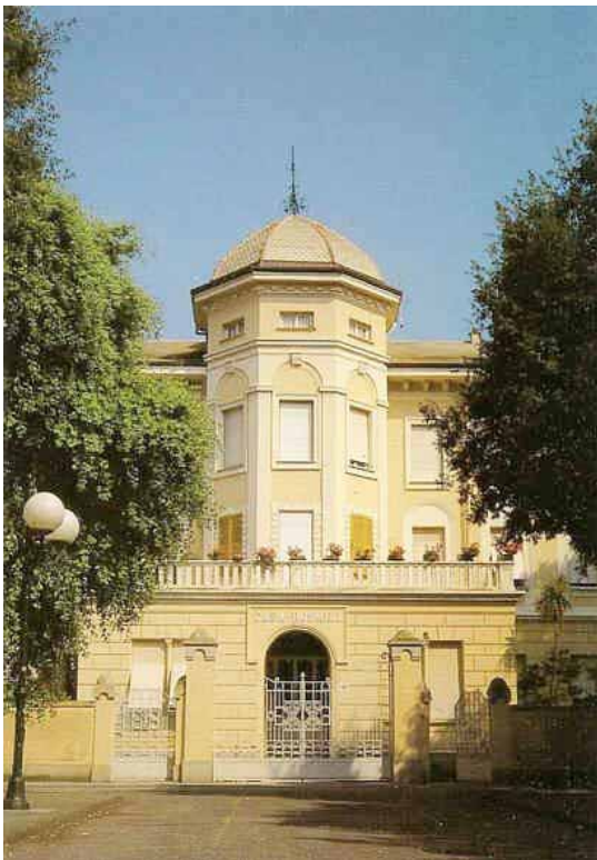
Casa Rosmini oggi.

Ad immortalare l'evento c'erano due operatori di Telepace, il cui servi-