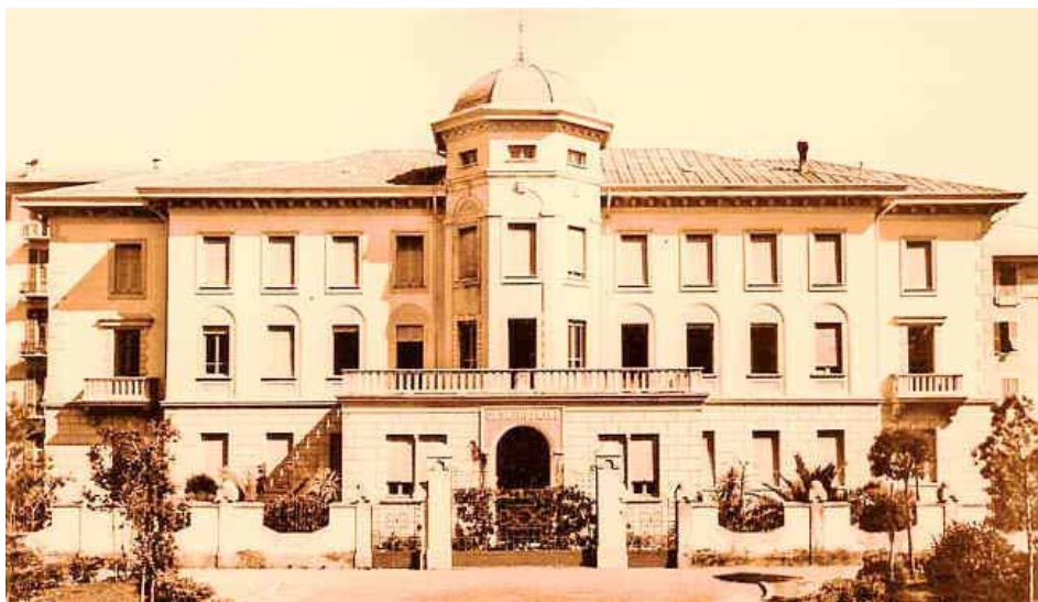
Casa Rosmini nel 1939.

L'atteggiamento comune è quello di scoprire il volto di Dio in ogni volto umano – uomo o donna, anziano o bambino, italiano o straniero – e di servirlo con gioia nelle sue necessità. Uno stile, quindi, come espressione dell'amore di chi per vocazione professa la carità universale e, di volta in volta, si fa accoglienza, ascolto, dialogo, amicizia, compagnia per quanti bussano alla nostra porta.